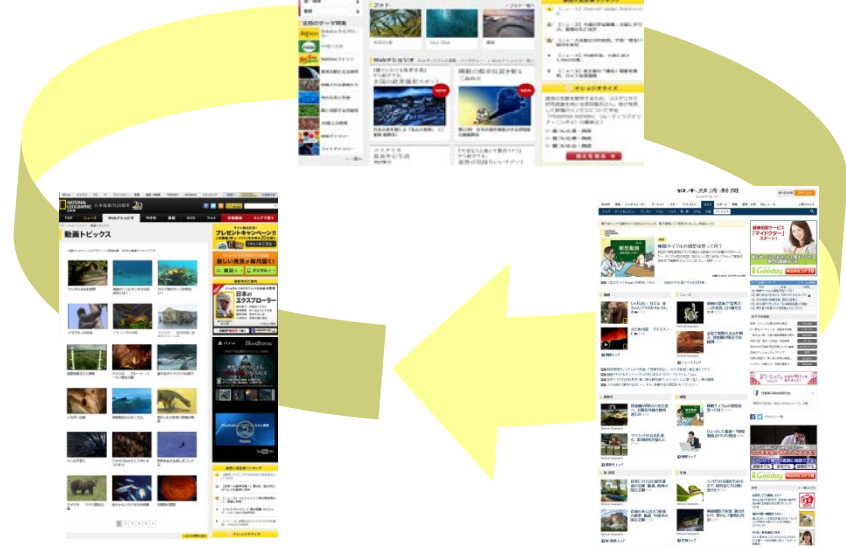
＜ナショジ動画コーナー＞