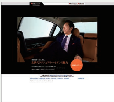
タイアップサイト1ページ目