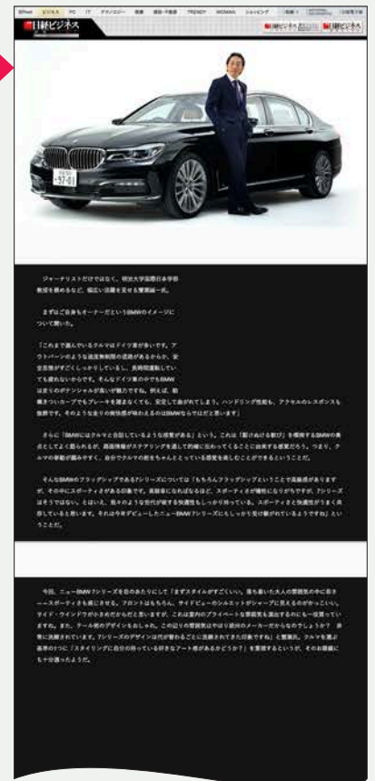
タイアップサイト2ページ目

※パーミッション画面は別画面表示になる場合と記事ページに組み込まれる場合があります この違いはサイトの構造によるものですが、詳しくはお問い合わせください